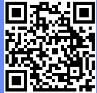
Hitract på Google Play

På vår hemsida finns även ytterligare information till dig som är ny i Lund. Kolla gärna in vår hemsida www.beteendevetareilund.com . Där kommer även ett schema för nollningsperioden snart att publiceras!